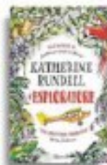
Katherine Rundell «L'espionstore» Rizzoli pp. 332, € 17