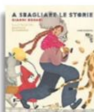
Gianni Rodari «A sbagliare le storie» EL pp. 32, € 14,90

La scuola dovrebbe essere luogo di incontri e di accoglienza, di scambio e di ami-