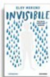
Eloy Moreno «Invisibile» Mondadori pp. 313, € 16