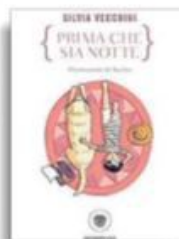
Silvia Vecchini «Prima che sia notte» Bompiani pp. 128, € 10