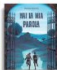
Patricia Rinaldi «Hal la mia parola» Sinnes pp. 212, € 14