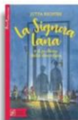
Jutta Richter «La signora Lana e il profumo di cioccolato» Beisler pp. 142, € 14,90